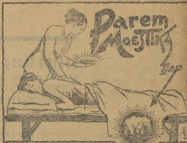
Boleh dapet pada TAN TJOEN TAT SALATIGA.

Djoega bisa trima pesenan boekoe-boekoe, apa toewan poenja maooe, bikinan di tanggoeng baik dan koewat. Dari harga melawan lain-lain toko dan lain-lain firma.